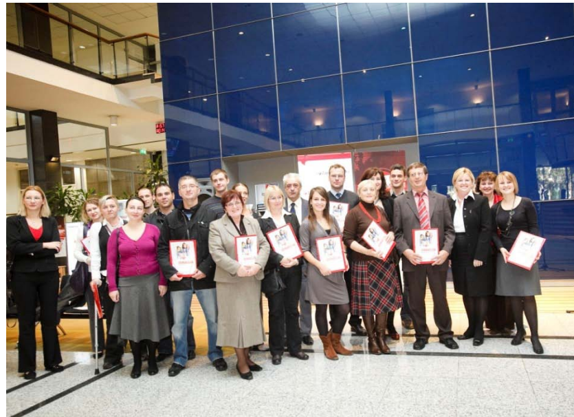
Dobitnici donacija 2009.