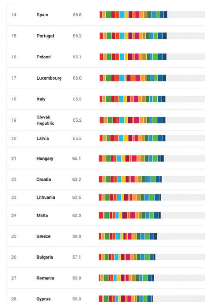
Slika 1: Ostvarenost Ciljeva održivog razvoja po zemljama članicama EU

Izvještaj konstatira da sve države članice EU već imaju okvir za provođenje COR, SDSN potiče vlade da mobiliziraju sredstva za ostvarenje COR a novoizabranu Europsku komisiju da uskladi fiskalni proračun, investicijske strategije i razvoj regulative s Ciljevima održivog razvoja, uključujući i kroz okvir novog Europskog zelenog sporazuma (Green New Deal) te da COR pozicionira u centar svojih diplomatskih i razvojnih suradnji. Europski SDG Index daje mnogo informacija o rangiranju zemalja članica prema pojedinom cilju te ukupne rezultate Europske unije. Slike u prilogu pokazuje neke od tih rezultata, a više možete pronaći na https://eu-dashboards.sdgindex.org/ .